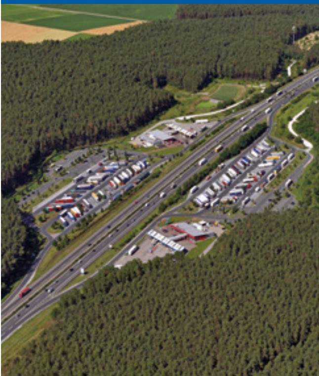
Tank- und Rastanlage Kammersteiner Land