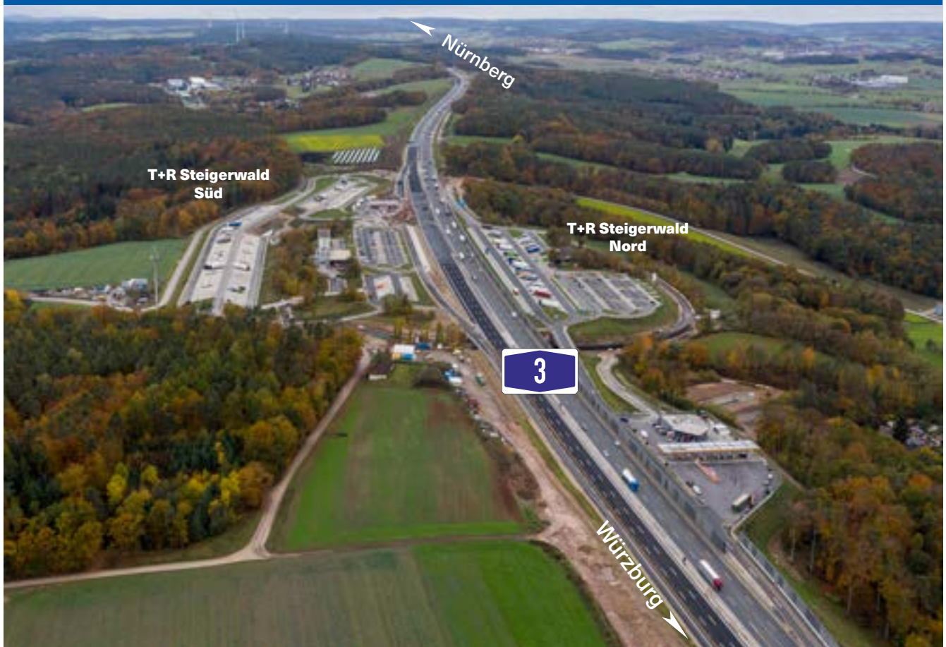
Bauarbeiten an der Tank- und Rastanlage Steigerwald

Bereits 2016 wurde durch die Autobahn Tank & Rast GmbH das Rasthaus Süd sowie 2017 das Motel Süd durch je einen modernen Neubau ersetzt. Die Tankstelle Süd und das Rasthaus Nord konnten im Bestand erhalten werden. Mit dem Ausbau wurden auf der Nordseite neue Schnellladesäulen für E-Autos errichtet. Auf der Südseite wurden die baulichen Voraussetzungen für die potentielle Erweiterung der vorhandenen Schnellladesäulen geschaffen.