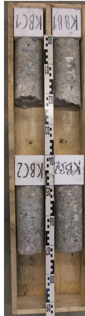
KB B1 -KB C2 Pfeiler (Horizontalbohrungen)