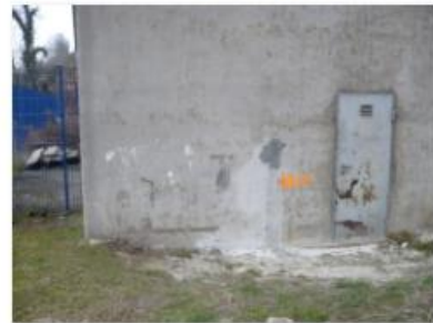
Lage KB C 1.JPG