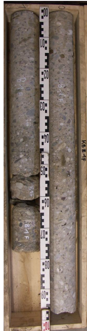
KB B1F Pfeilerfundament (Schrägbohrung)