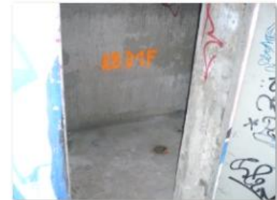
Lage KB D 1 F.JPG