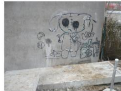
Lage KB C 2.JPG