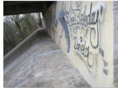
Lage KB A.JPG