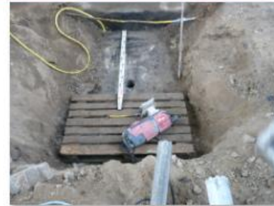
Lage KB B 1 F.JPG