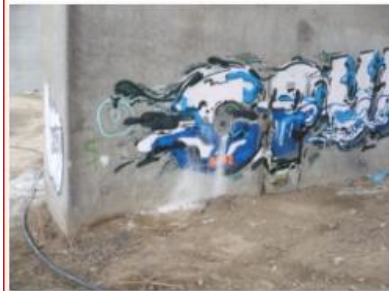
Lage KB B 2.JPG