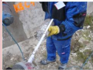
Kernentnahme KB C 1.JPG