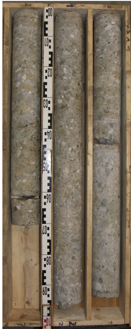
KB AW Widerlager (Horizontalbohrung)