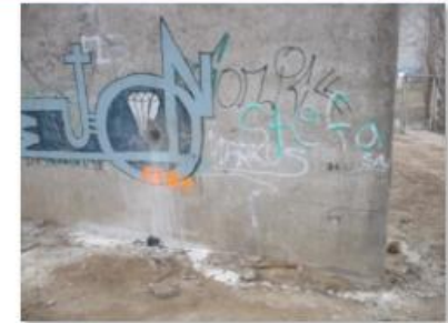
Lage KB B 1.JPG