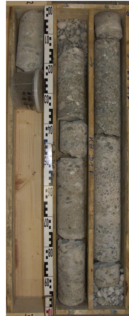
KB D1F Pfeilerfundament (Vertikalbohrung)

Bohrkerne Unterbauten, Bohrkernentnahme Terrassond