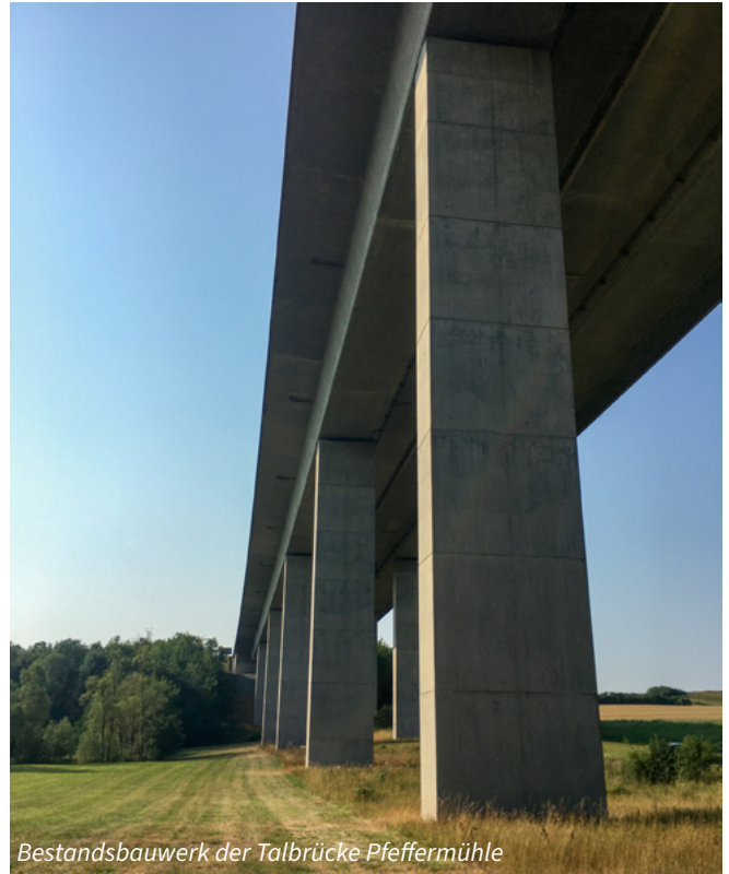
Bestandsbauwerk der Talbrücke Pfeffermühle

Die geschätzten Kosten der Maßnahme in Höhe von rund 63,7 Millionen Euro trägt der Bund.