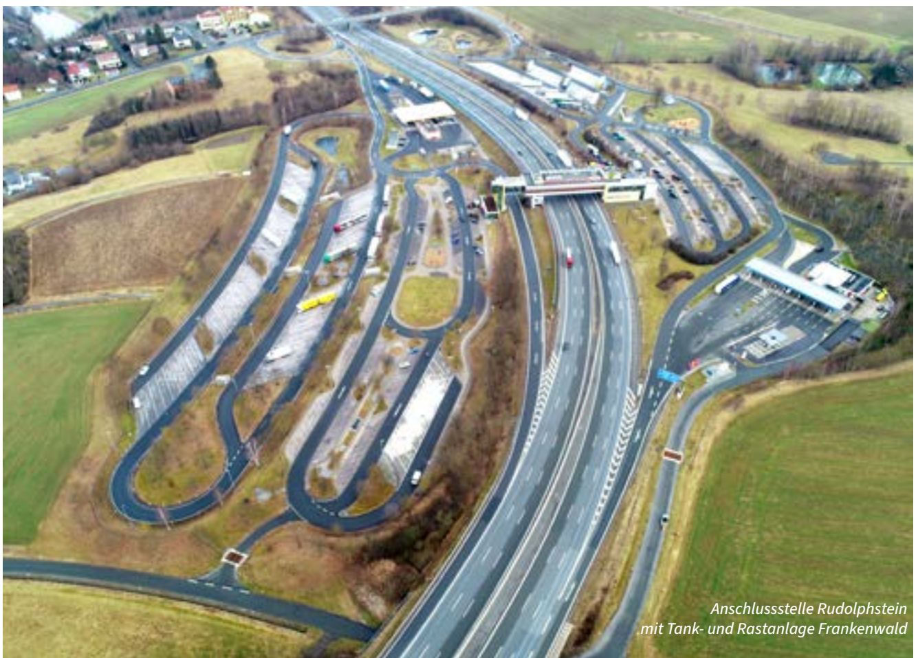
Anschlussstelle Rudolphstein mit Tank- und Rastanlage Frankenwald