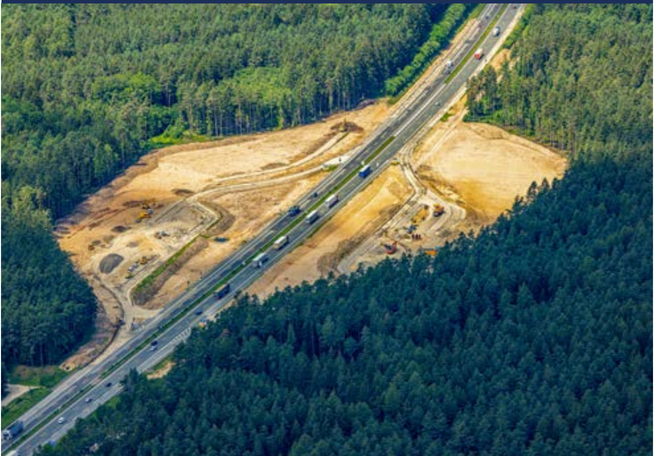
Laubenschlag Nord und Süd

Der Bau erfolgt in mehreren Phasen bis Mitte 2026.